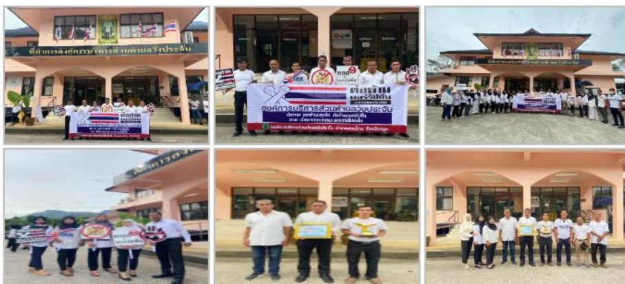
คลิกที่ภาพเพื่อชมภาพขนาดใหญ่

การดำเนินงาน จัดกิจกรรมโดยคณะผู้บริหาร สมาชิกสภาองค์การบริหารส่วนตำบล ตลอดจนเจ้าหน้าที่ขององค์การบริหารส่วนตำบลวังประจัน รณรงค์และให้ความรู้ตลอดจนจัดกิจกรรมต่อต้านการทุจริตในองค์กร ในวันที่ ๙ ธันวาคม ของทุกปี คือ วันต่อต้านคอร์รัปชันสากล ณ ที่ทำการองค์การบริหารส่วนตำบลวังประจัน